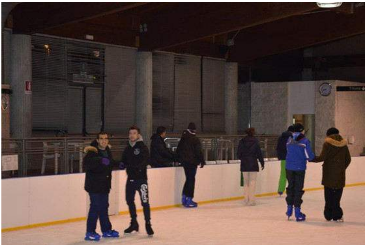
Alcune immagini delle attività dell'associazione

Nell'ultimo quinquennio Gaudio ha avviato progetti di pattinaggio sul ghiaccio (I Pattinatori), ciclismo (Pedalare in Blu), vela (Vela Gaudiosa all'Isola D'Elba), di cui hanno beneficiato una trentina di ragazzi autistici di età diverse.