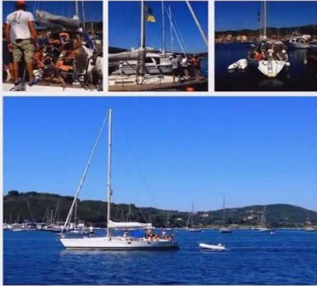
Alcune immagini delle attività dell'associazione

Gaudio Onlus ( www.autismogaudio.org ) è un'associazione di genitori di persone autistiche, costituita nel 2011 a Mediglia (e sede anche a San Donato Milanese) allo scopo di riempire il vuoto esistente, diffondere conoscenze corrette sull'autismo e sviluppare progetti per le persone autistiche e le loro famiglie.