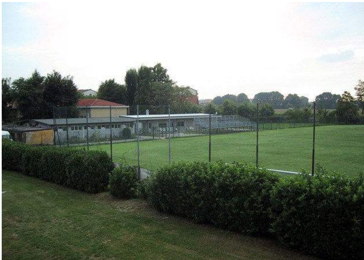
Alcune immagini del campo di calcio di Linate

Infine, anche la Prima Squadra del Brera – militante in Prima Categoria – nella prossima stagione giocherà a Linate, poiché l'Arena Civica di Milano (storico stadio del Club) sarà chiusa per restauri.