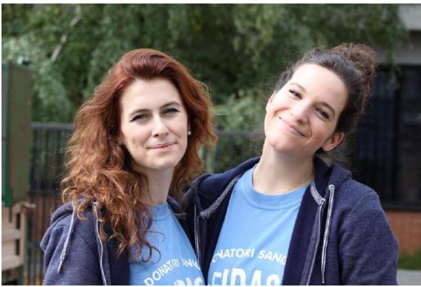
Foto di gruppo di FidasLab del Novembre 2018