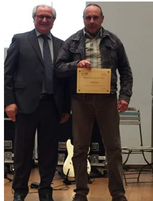
Alcune immagini della giornata