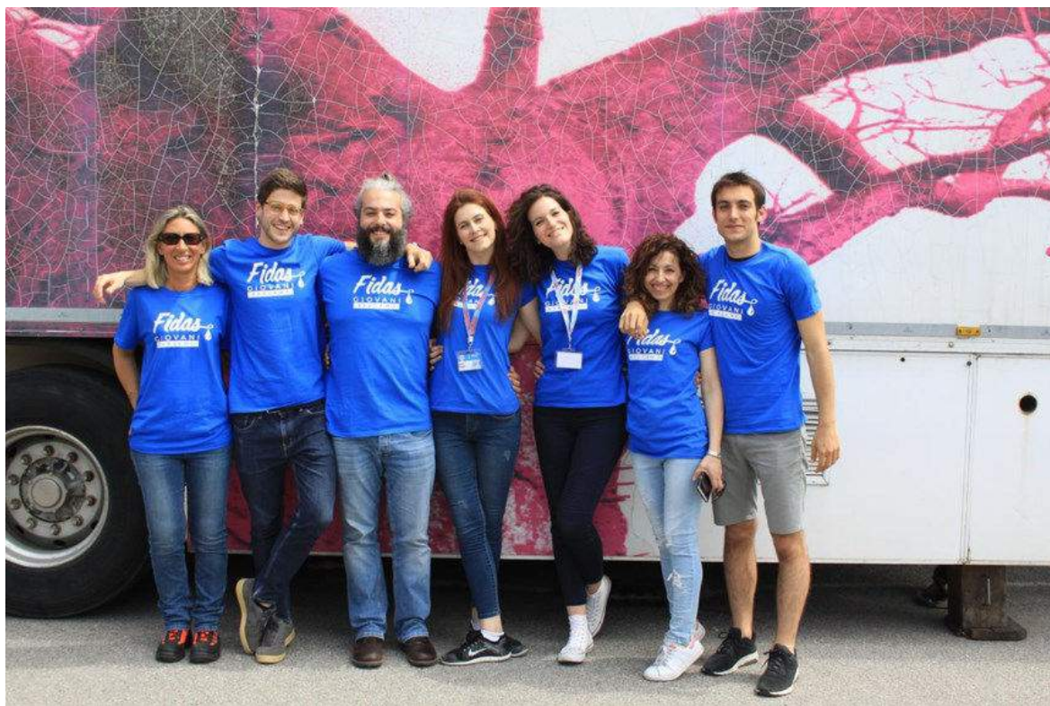
Con il Team del Baobab del San Raffaele

Sono tanti infatti gli appuntamenti che ci coinvolgono direttamente e ai quali tutti i giovani delle federate possono prendere parte: ogni anno il coordinamento giovani nazionale organizza con una federata regionale il Meeting Nazionale dei Giovani Fidas, quest'anno già arrivato alla ventesima edizione, ha avuto luogo a Torino dal 22 al 24 marzo!