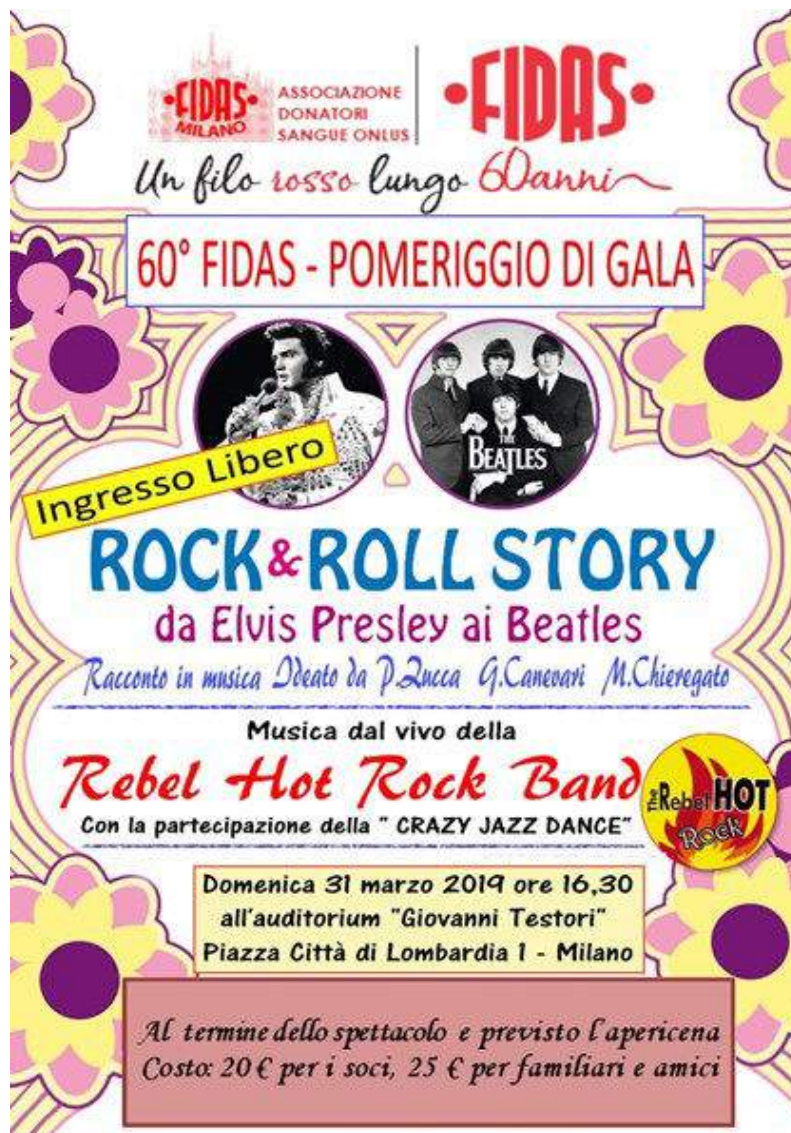
La locandina dell'evento

Ma un anniversario va sicuramente festeggiato e quindi abbiamo deciso, per quest'anno, di organizzare un evento diverso dal solito in concomitanza con l'annuale assemblea.