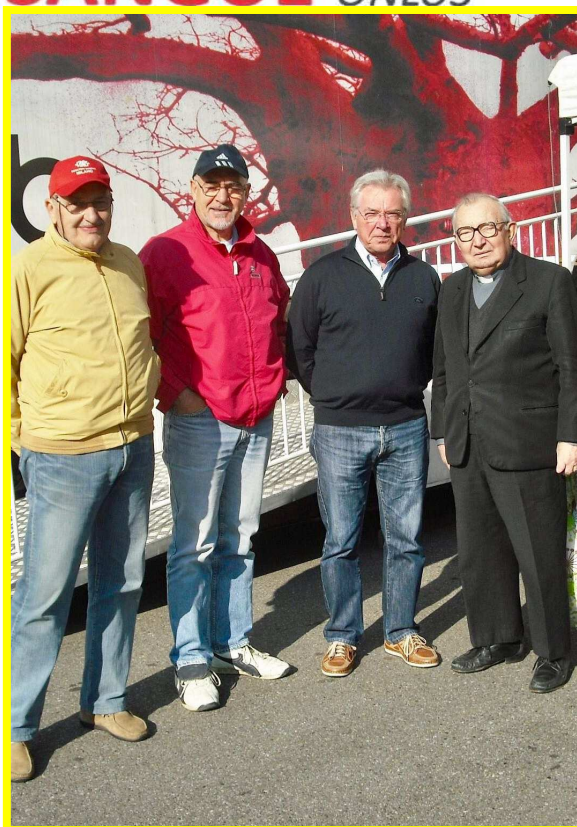
Don Antonio con alcuni donatori

Non vuol dire solo invecchiare di un anno, da questa età inizierete ad assumervi tutte le vostre responsabilità di cittadini, ed implica maggior serietà un cambiamento totale